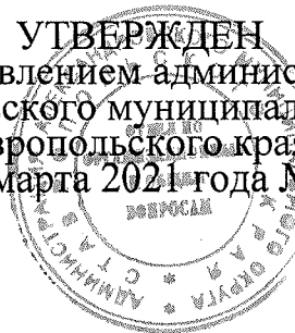
График медицинского обслуживания пришкольных лагерей с дневным пребыванием детей в летний период 2021 года